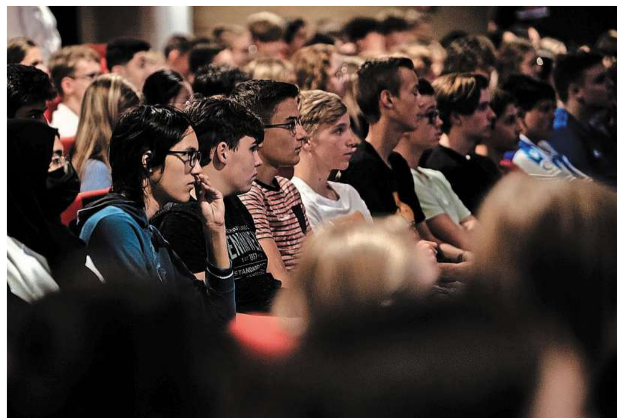
304 vierdejaars van het Kennemer College luisterden ademloos naar de lezing over klimaatverandering. FOTO HELEEN VINK

Hoofredacteur: Corine de Vries, Jan 't Hart (adjunct) en Gerben van 't Hek (adjunct) Secretariaat: redactiesecretariaat@mediahuis.nl Hoofdkantoor: Mediahuis Nederland B.V. Basisweg 30, 1043 AP Amsterdam 088 - 8249111 Redactiechef: Annemiek Jansen Regiokantoor: Stationsplein 2, 1948 LB Beverwijk redactie@ijmuidercourant.nl, tel. 0255-561800 redactie.ken@nhd.nl, tel. 0251-207620 Online: www.ijmuidercourant.nl Twitter @ijmuidercourant facebook.com/IJmuidercourant www.nhd.nl Twitter @nhdagblad facebook.com/NHD - Dagblad Kennemerland Raad voor de Journalistiek: IJmuider Courant en Dagblad Kennemerland volgen de leidraad van de Raad voor de Journalistiek. Ga naar: rvdj.nl. Vragen van abonnees: Voor bezorgklachten of vragen over abonnement: mijn.ijmuidercourant.nl mijn.noordhollandsdagblad.nl, bel Klantenservice, 088 - 8241111 of maak gebruik van onze WhatsApp-service op 072-5184020. Openingstijden: Werkdagen: 08.00 - 17.00 uur Zaterdag: 08.00 - 11.00 uur Advertentie opgeven: samenwerken@mediahuis.nl Familieberichten: 088 - 8240135 of familieberichtenopinternet.nl. Rechtenvoorbehoud: Alle rechten t.a.v. deze uitgave worden uitdrukkelijk voorbehouden en berusten bij Mediahuis Nederland B.V. Op het gebruik van deze uitgave is het bepaalde in de algemene gebruiksvoorwaarden van Mediahuis Nederland van toepassing: mediahuis.nl/gebruiksvoorwaarden. ©Mediahuis Nederland B.V., 2020